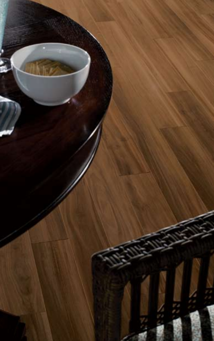
Frutales selectos L3044