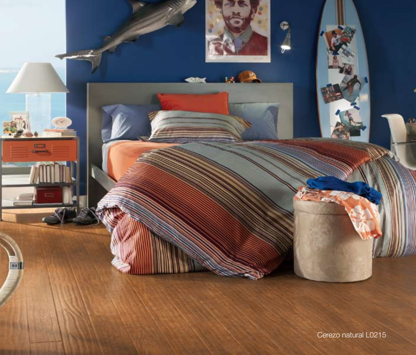
Cerezo natural L0215